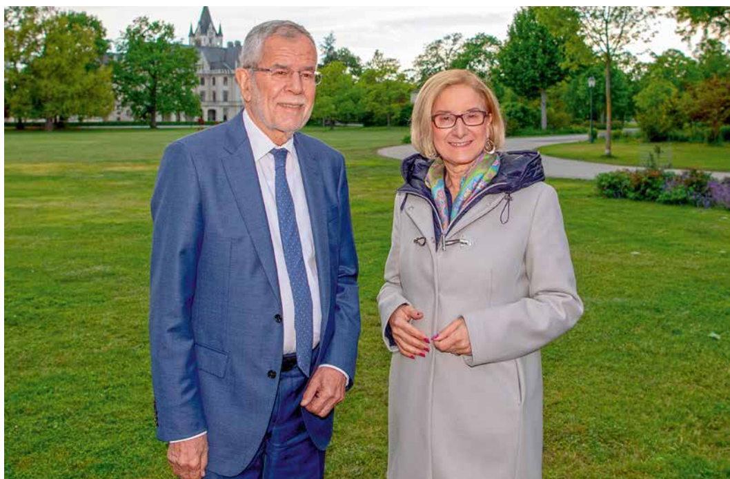
Schloss Grafenegg: Landeshauptfrau Johanna Mikl-Leitner und Bundespräsident Alexander Van der Bellen.

Bei einer Festveranstaltung in der Grafenegger Reitschule ist am 9. Mai (Europatag) an „30 Jahre Öffnung des Eisernen Vorhanges“ erinnert worden. Landeshauptfrau Johanna Mikl-Leitner unterstrich in ihrer Festrede die Bedeutung dieses Ereignisses für den Kontinent und auch für Niederösterreich. Europa habe damit „ein neues Gesicht bekommen“. Die Öffnung der Grenzen, der EU-Beitritt Österreichs und die EU-Erweiterung hätten Niederösterreich „unglaublich viele Vorteile gebracht“ und enorme Chancen und Perspektiven eröffnet, sagte die Landeshauptfrau. „Aus einer vergessenen und benachteiligten Region ist eine blühende und prosperierende Region geworden, die heute hochgeschätzt und auch international anerkannt ist.“